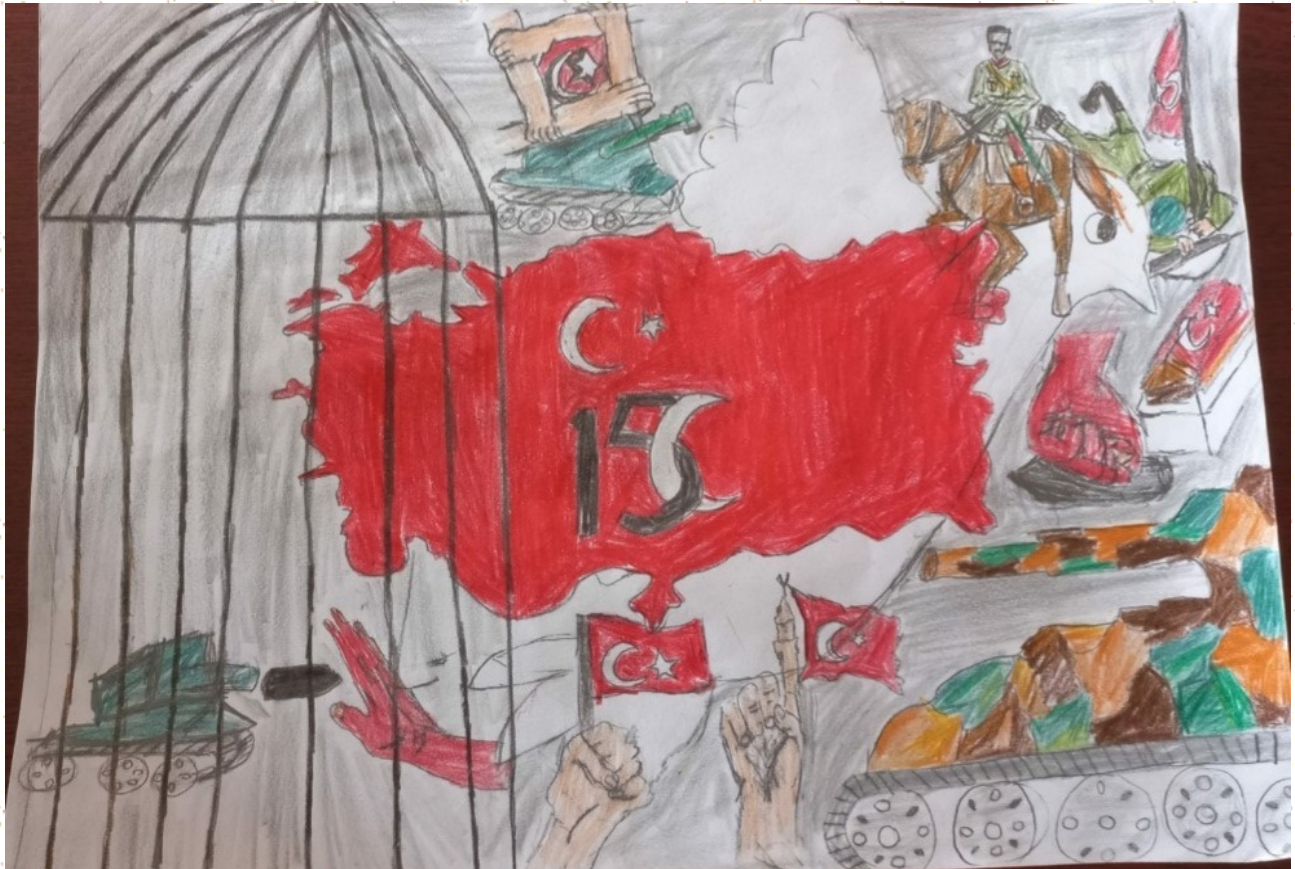
ÇİĞDEM TUĞRUL 8-A